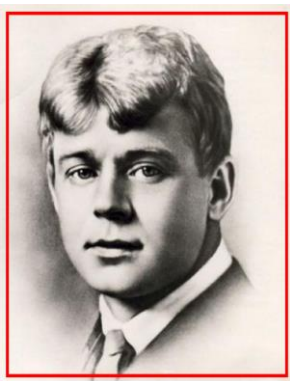
поэт С.А. Есенин