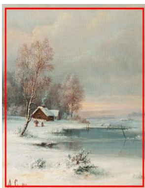
А.К. Саврасов «Зима»