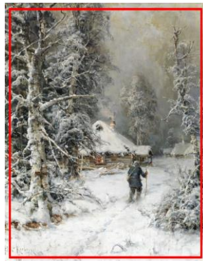
Ю.Ю. Клевер «Зимний пейзаж»