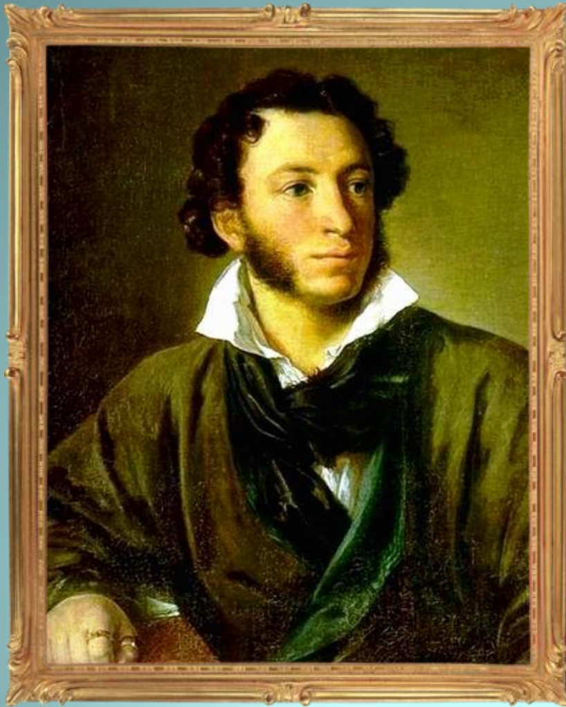
А.С. Пушкин «Зимнее утро»