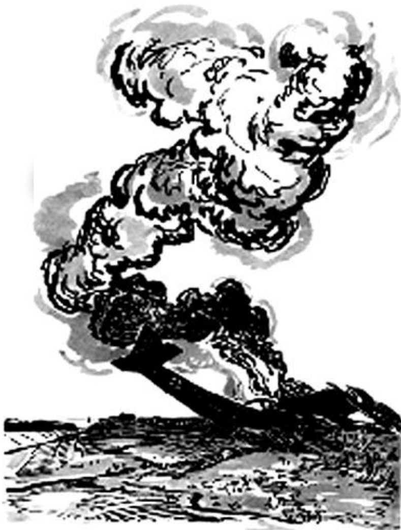
Иллюстрация И. Бруни к поэме А. Т. Твардовского «Василий Тёркин»