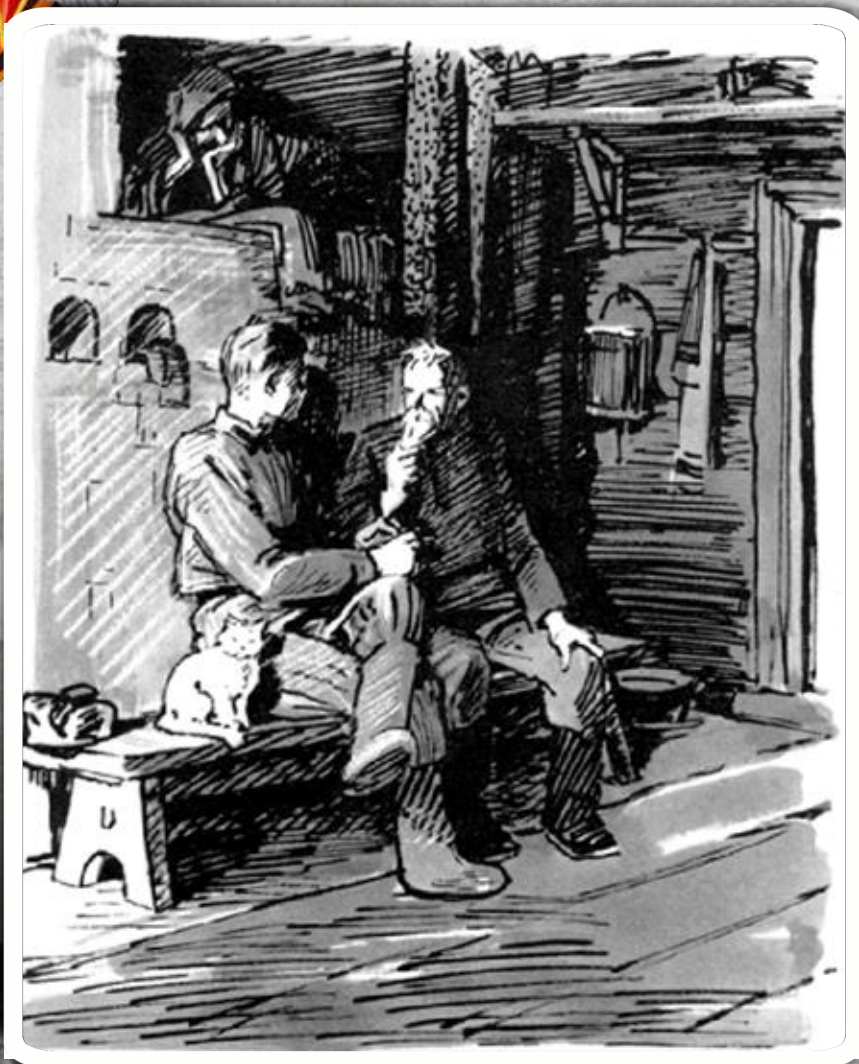
Иллюстрация И. Бруни к поэме А. Т. Твардовского «Василий Тёркин»