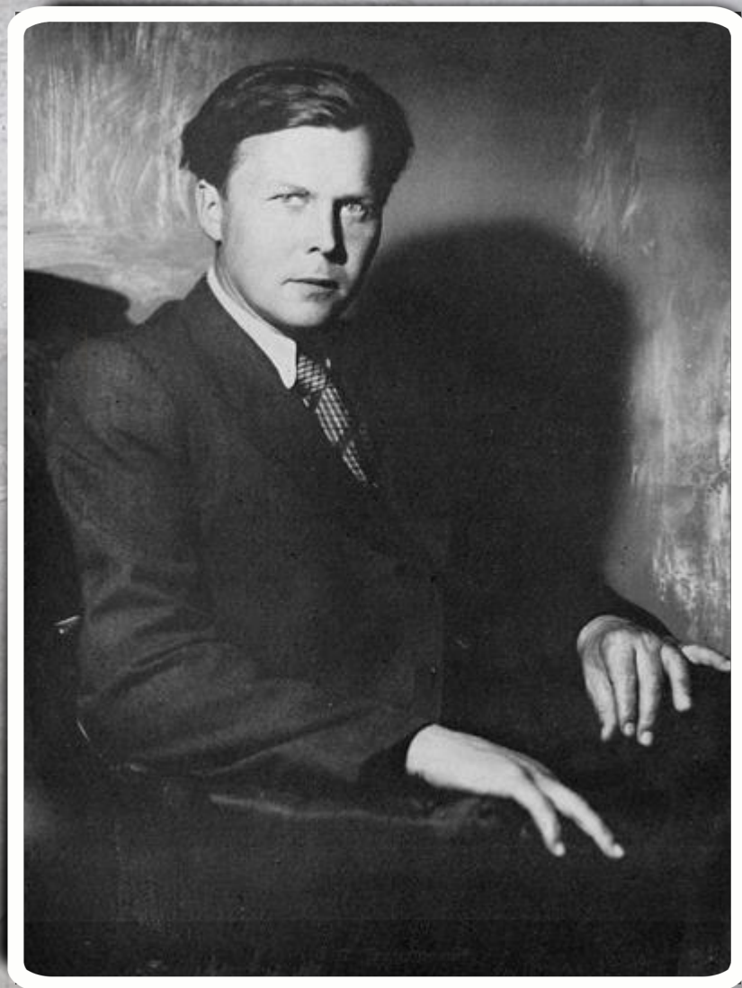
Фотография 1940 г.