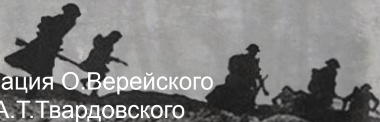
Иллюстрация О.Верейского к поэме А.Т.Твардовского «Василий Тёркин»