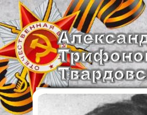
Александр Трифонович Твардовский